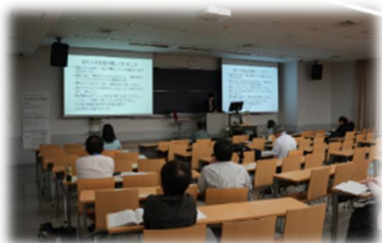
ラウンドテーブル