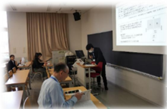
若手チャレンジ研究会