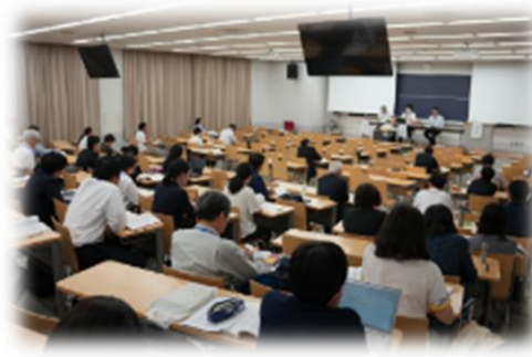
準備委員会シンポジウム

大会初日の終了後に、大会会場から徒歩5分、日本大学文理学部御用達で教員・学生の日常的なたまり場でもある居酒屋「たつみ本店」の3階を貸し切って懇親会を開催しました。2019年の長崎大会以降、コロナ禍のために懇親会は開催できませんでしたが、久々の懇親会ということもあり、参加者は満員御礼の60名でした。