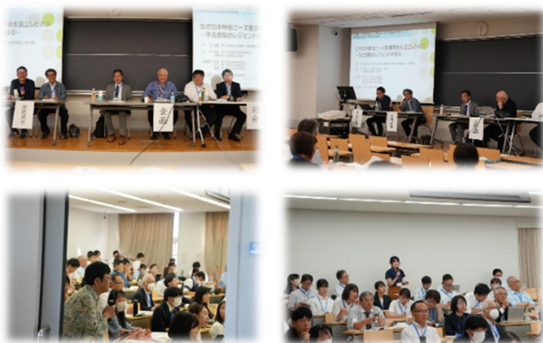
学会設立30周年記念シンポジウム

学会創設を担った3人の話題提供者より、学会創設に至るまでの問題意識や取り組みが具体的に紹介されるとともに、学会創設から30年間における特別ニーズ教育研究の学史的整理が不可欠であること、その作業に基づいて本学会の現代的意義・役割について明らかにしていくことは、少なくとも本学会の次の10年を展望していくためにも必要であることなどが問題提起され、フロアと議論が進められました。