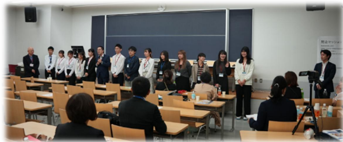
準備委員会・大会支援学生スタッフ